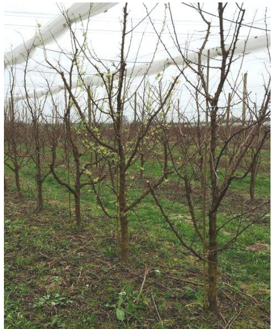
Arbre malade à feuillaison précoce

Évaluation du risque : Risque en cours. Respectivement 4 et 1 individus ont été capturés cette semaine sur les 2 sites de battages. Nous constatons donc une diminution des captures cette semaine. Cependant, cette dynamique de capture sera à confirmer la semaine prochaine.