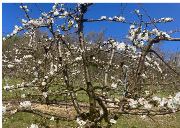
Cerisier variété Folfer - Stade E