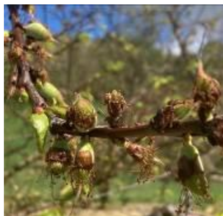
Abricotier variété Wondercot- Stade I Photo Philippe PRIEUR 2024