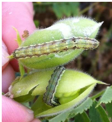
Chenilles d'H. armigera dans gousses de pois chiche

Le suivi de ce ravageur est réalisé avec des pièges en végétation qui permettent de détecter la présence de papillons et suivre les vols. Pour 2020, 34 pièges sont déployés sur le territoire.