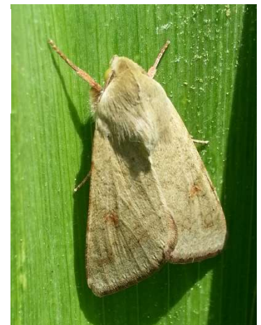
Papillon d'H. armigera - Ph Papillon d'H. armigera

Un second vol est en cours sur le territoire depuis le début du suivi dans les parcelles de pois chiche. Les conditions sont propices avec le retour de températures estivales et l'ensemble des parcelles sont actuellement dans la période de risque. L'avancée de la maturité des plantes signalera la sortie de la phase à risque.